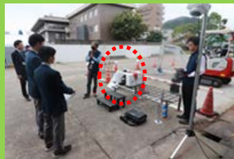
ロボットによる出来高管理