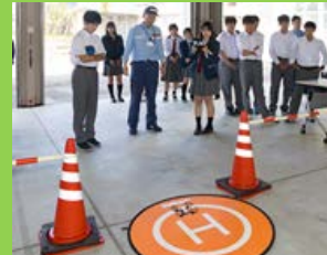
ドローン操作体験