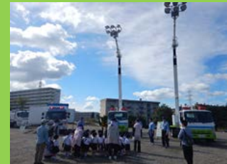
TEC機材（炎対本部車等）見学