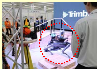
自立4足歩行ロボット実演